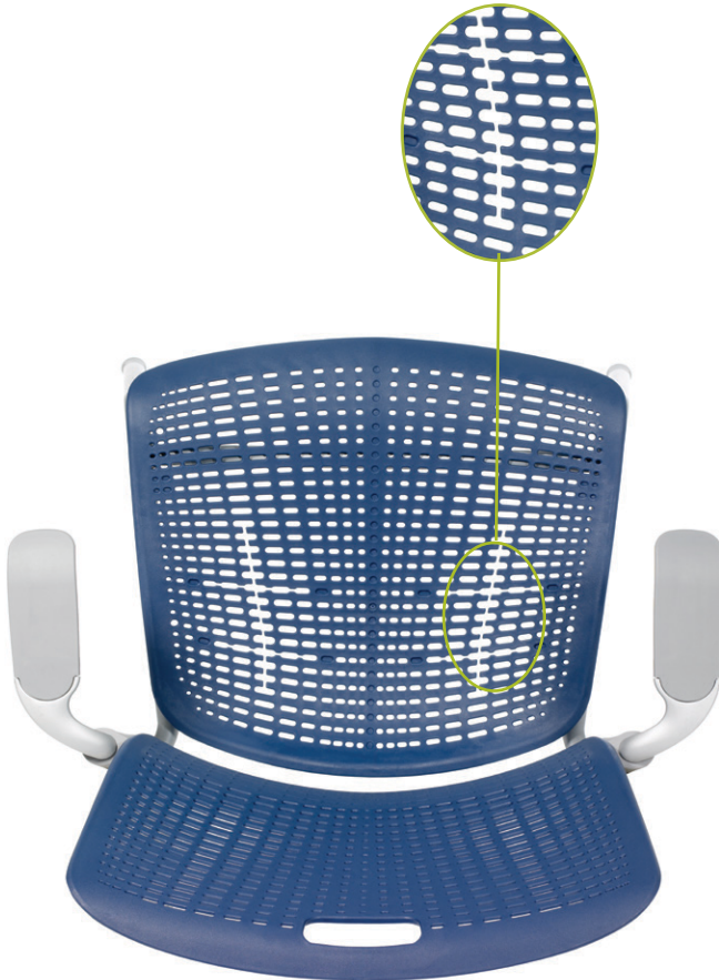
Assise à Rainures Croisées