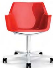
RE5-2 A : 20 1/2" C : 17" - 21" E : 17 1/2"