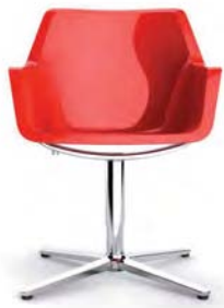
RE4-2 A : 20 1/2" C : 16" - 20" E : 17 1/2"