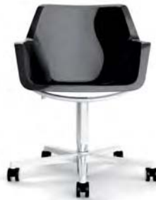
RE5-1 A : 20 1/2" C : 17" - 21" E : 17 1/2"