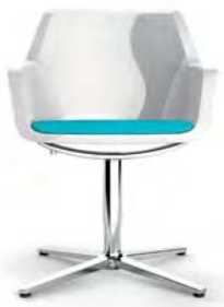
RE4-3 A : 20 1/2" C : 16" - 20" E : 17 1/2"