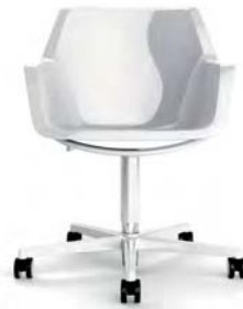
RE5-3 A : 20 1/2" C : 17" - 21" E : 17 1/2"