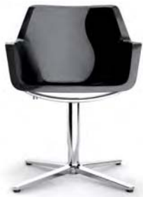
RE4-1 A : 20 1/2" C : 16" - 20" E : 17 1/2"