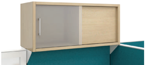
Rayon fermé partagé avec porte coulissante.