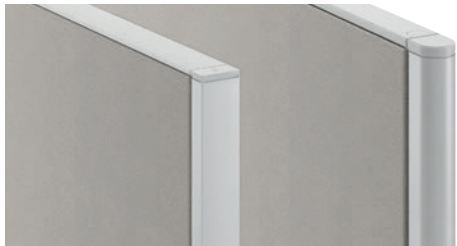
Profilés de recouvrement de la série N7 [carrée] ou de la série N2 [arrondie].