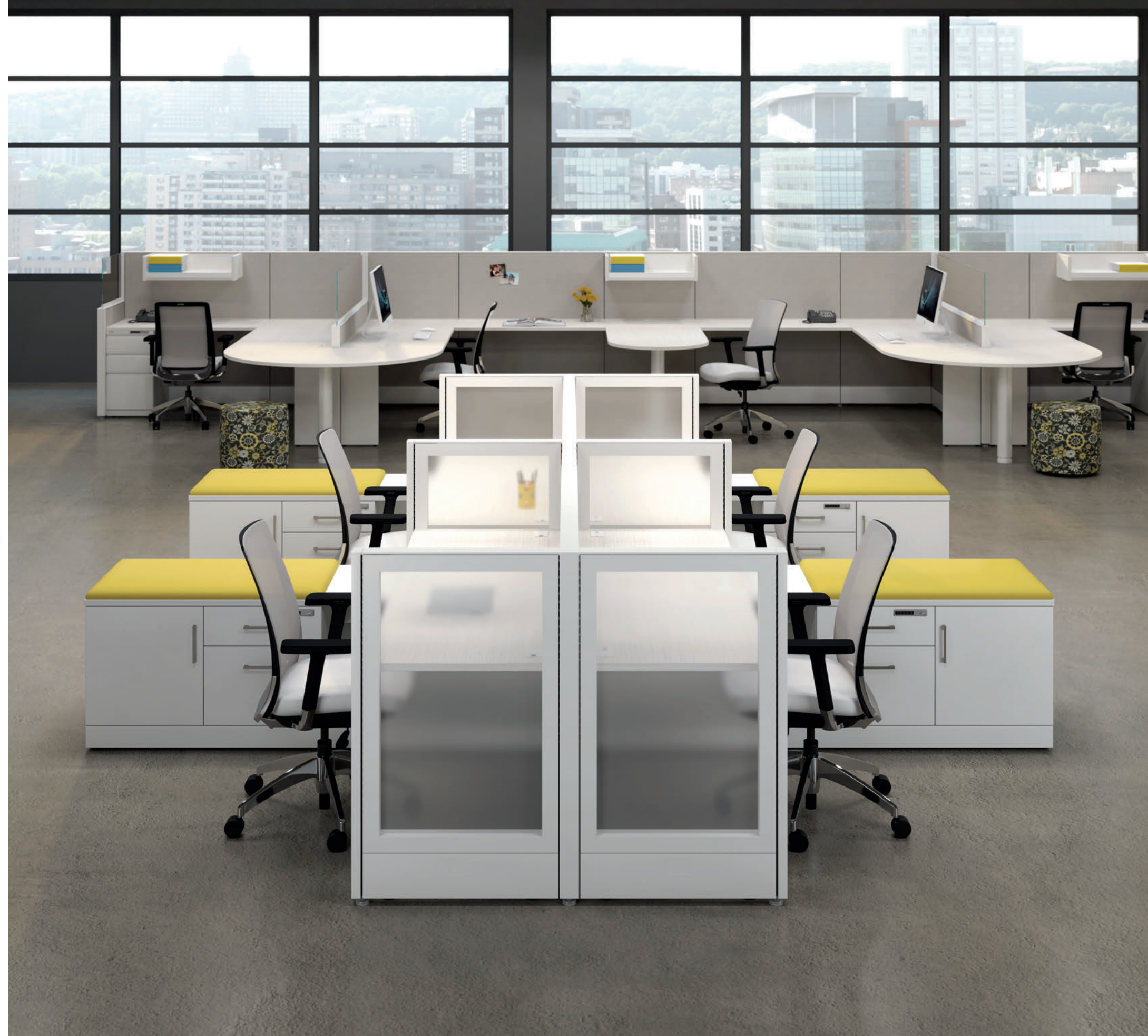
Écran séparateur en verre 8" ou 16" H.